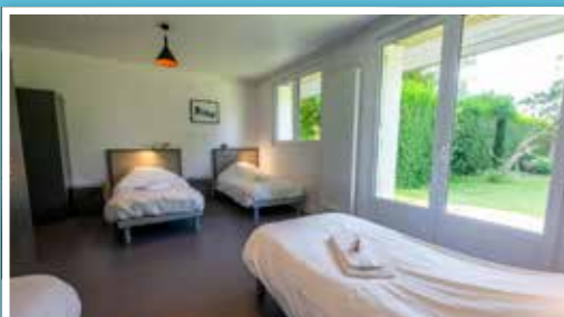
Hostel (auberge collective) 18 chambres

Profitez du restaurant « Le Carré » pour vous restaurer au milieu d'une végétation luxuriante.