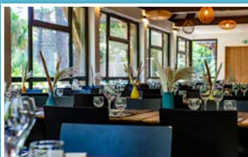
Restaurant Le Carré

Profitez du restaurant « Le Carré » pour vous restaurer au milieu d'une végétation luxuriante.