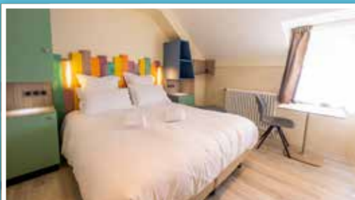
Hôtel 26 chambres

Les Maisons de Tatihou vous accueillent du 1 er avril au 12 novembre 2023 pour un séjour dépaysant et à l'écart du monde, dans des bâtiments chargés d'histoire.