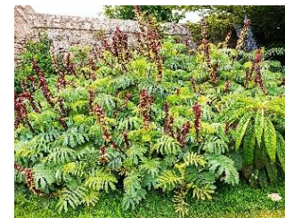
5. Plante cacahuète