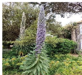
8. Vipérine (Echium)