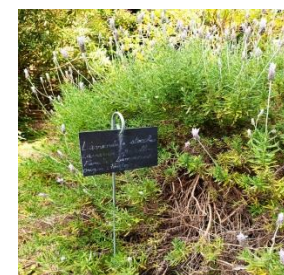
15. Lavande papillon