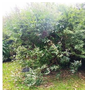
13. Vitex agnus